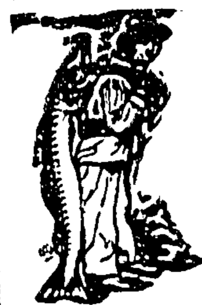
Nur echt mit dieser Marke — dem Garantzeichen des Scott'schen Fischlebens!

Ist ein Zeichen dafür, daß gewisse Mächte der Wille verloren ging, die erforderliche Nahrung aufzunehmen. Dies kann schlimme Folge haben, denn der Körper bedarf einer regelmäßigen Nahrungszufuhr, die unterbrochen wird, wenn keine Eklust vorhanden ist. Appetitlosigkeit und als Folge davon eine dauernde Unterernährung stellt sich häufig bei den in den Tropen lebenden Frauen und Männern ein, ein Zustand, der die Widerstands- und Leistungsfähigkeit ganz bedeutend vermindert, vielfach auch noch ernstlichere Störung des Befindens hervorruft. Der Gebrauch von Scotts Emulsion ist in solchen Zeiten ganz besonders angebracht. Sie wirkt sofort anregend auf den Appetit, das Essen schmeckt, die notwendige Nahrungszufuhr findet wieder in gewöhnlicher Weise statt, und damit ist die Hauptursache gewonnen. Die wohlschmeckende, dabei ungewöhnlich leicht verdauliche Scotts Emulsion verursacht keinerlei Magenbeschwerden. Diese Vorzüge erklären die allgemeine Beliebtheit dieses seit Jahrzehnten eingeführten in jeder Beziehung zuverlässigen Nahrungsmittels.