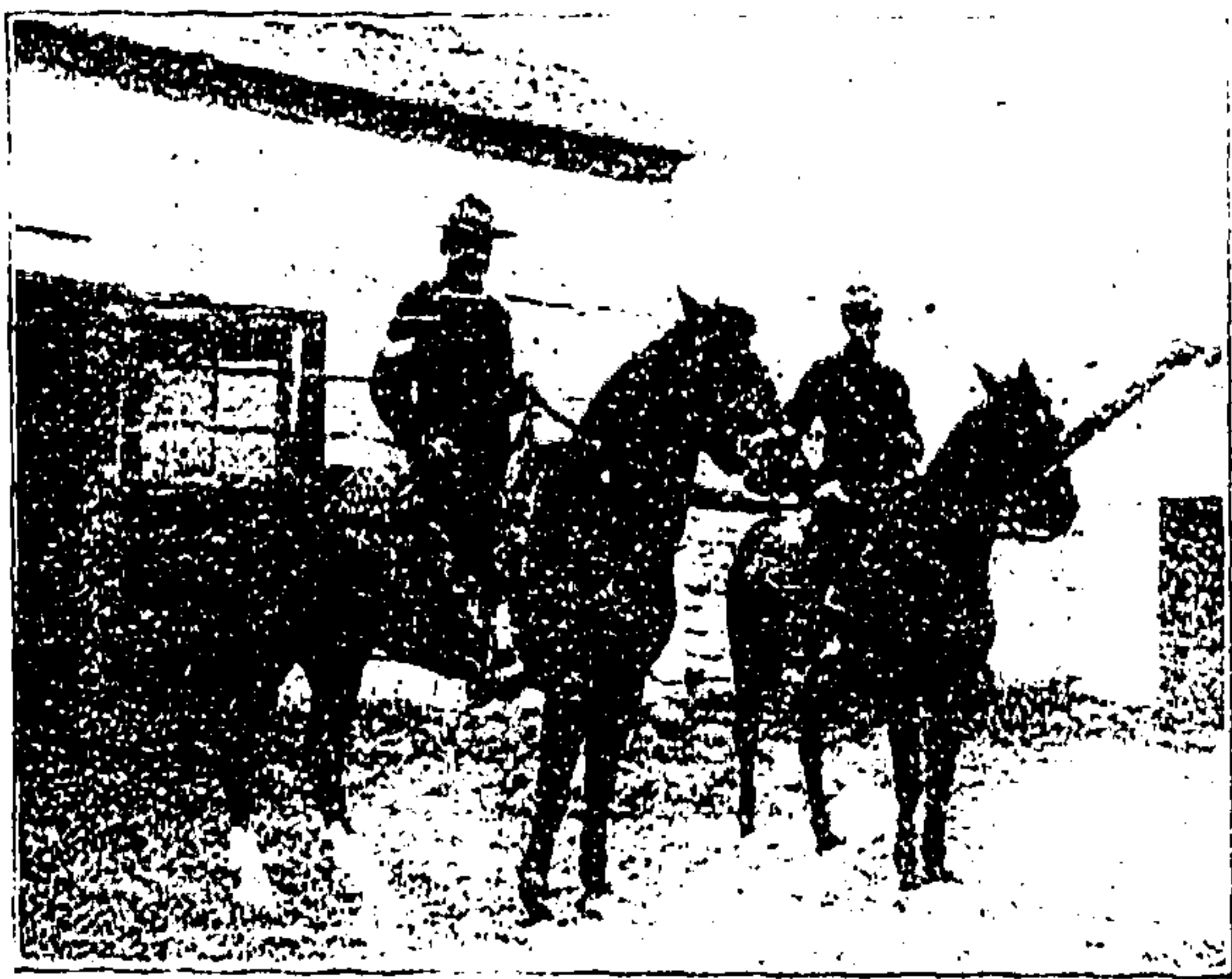
Manadische berittene Polizei. (Mit Text.)

„Soll das vielleicht eine Drohung sein?“ fragte der Erzbischof mit strengem Gesicht.