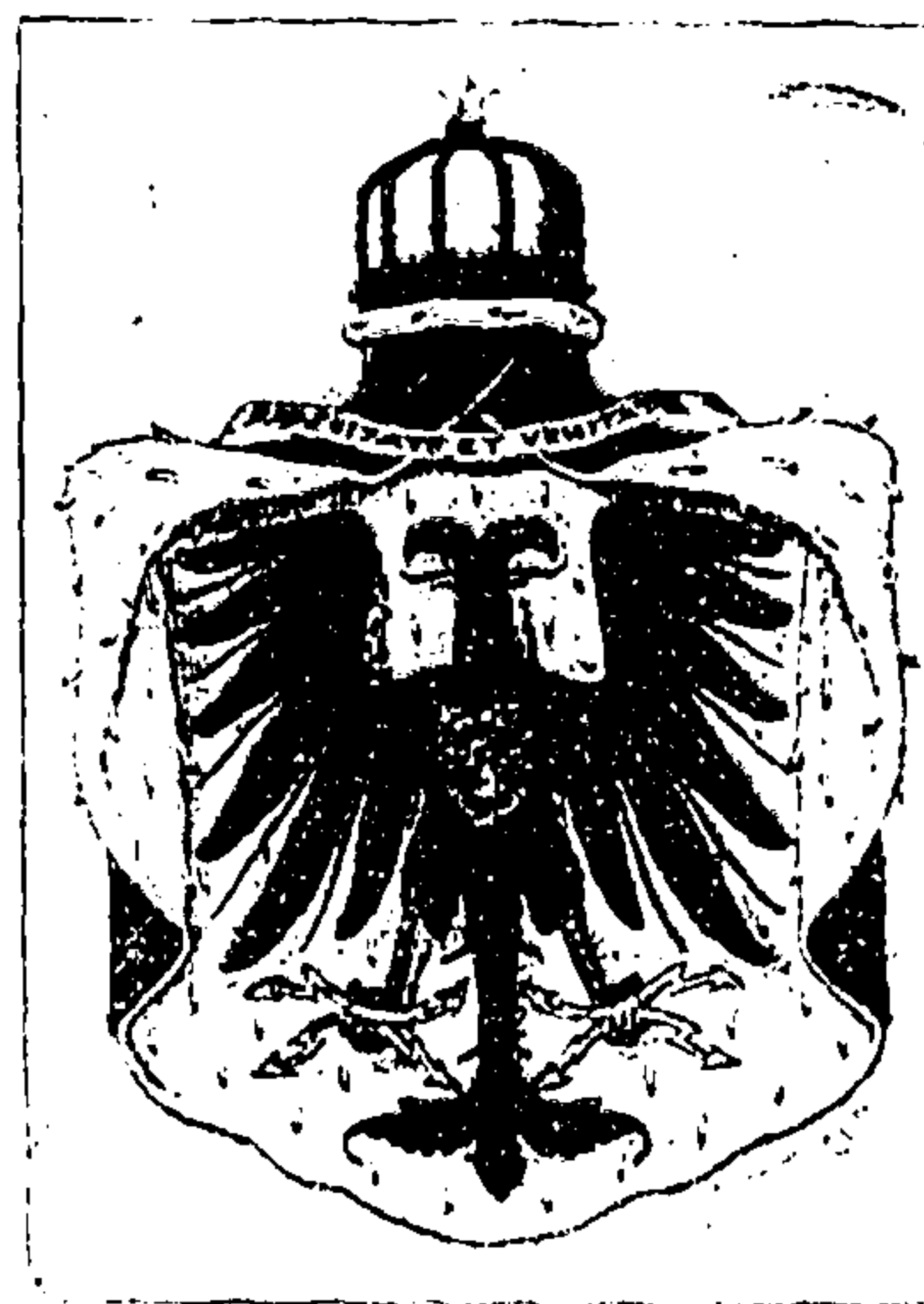
Neues Staatswappen Albaniens. (Mit Text.)

um sich, aber niemand hatte sich von seinem Platze gerührt. „Ich bitte Plak zu nehmen. Die Versammlung ist eröffnet.“