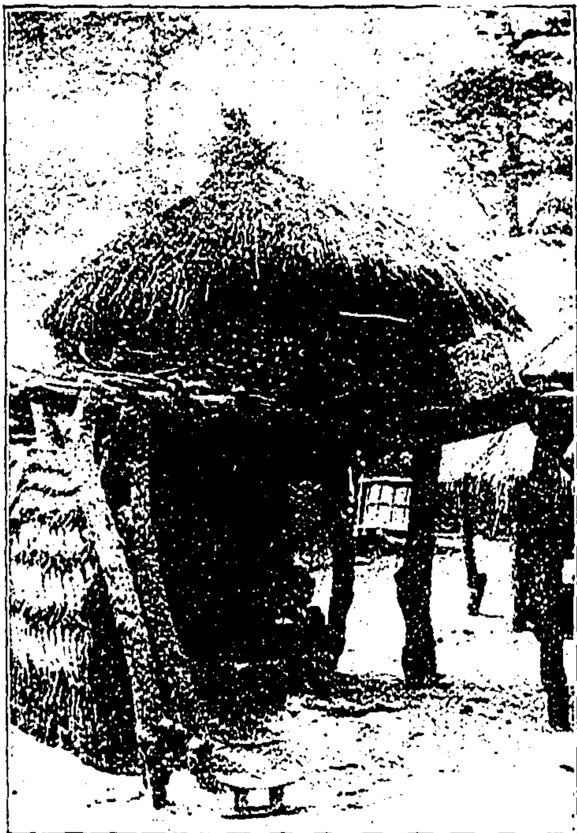
Eine afrikanische Maischemme. (Mit Text.)

Endlich blieb der Erzbischof stehen und wandte sich an die Versammelten. „Meine Herren,“ begann er, „wir haben schon länger gewartet, als eine zu weitgehende Höflichkeit es verlangt. Wie sehr Graf Winneburg unsere Beratungen achtet und schätzt, zeigt ja seine unentschuld bare Vernachlässigung des Amtes, das Ihr ihm übertragen habt und das er mit Freuden angenommen hat. Ich werde jetzt daher seine Stelle vertreten und ich bitte euch, Ihr Herren, zur Beratung Platz zu nehmen.“