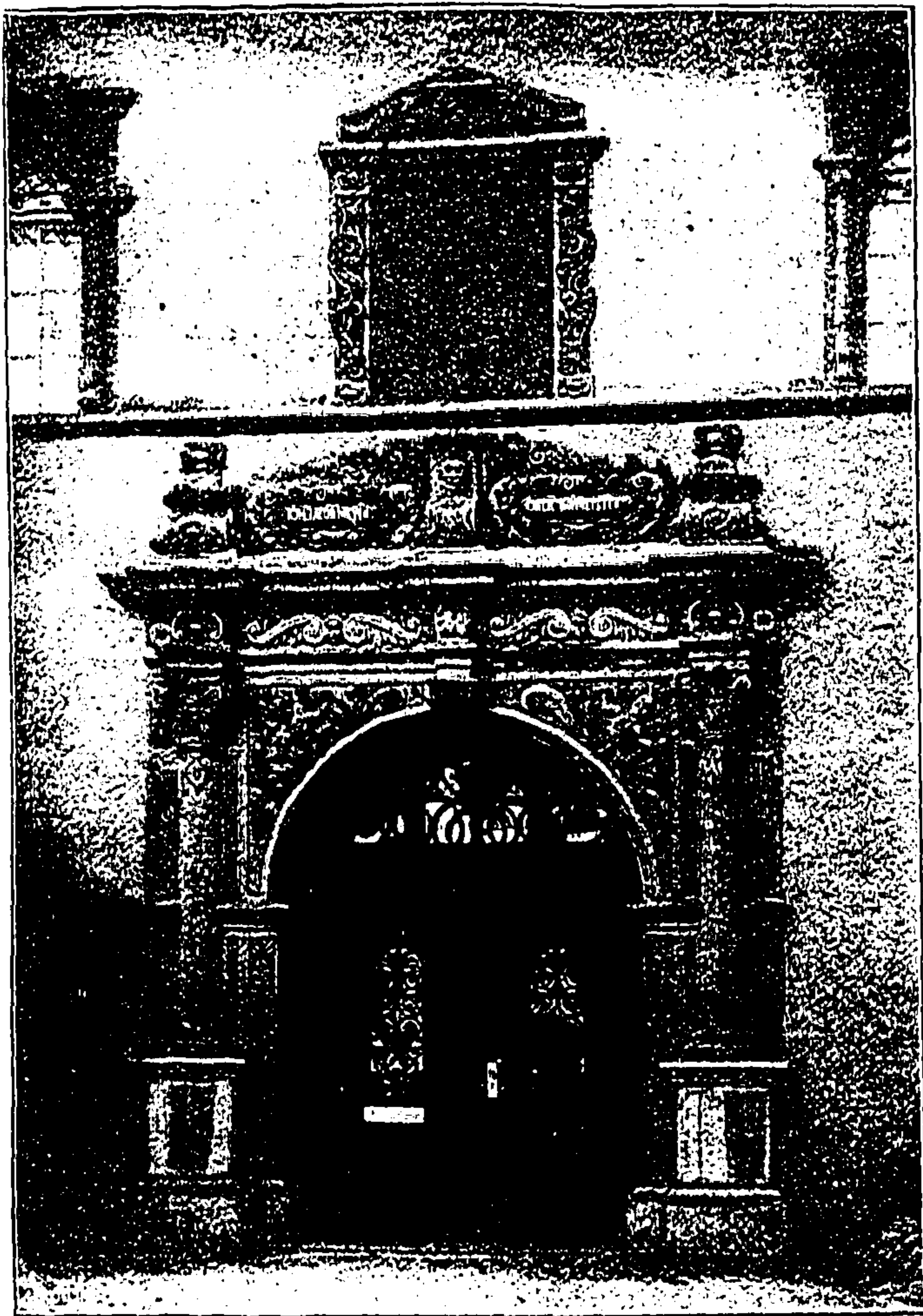
Das Portal am Rathhaus zu Schaffhausen. (Mit Text.)

als daß er ein Faß anstecken ließ, das die Kreuzenz eines guten Jahres enthielt. Seine Majestät hatten gelacht, weil sie glaubten, die Ritter dächten an die Sorge um ihren Magen, während sie sich doch tatsächlich um Leib und Leben sorgten. Als der Kaiser aber sah, daß sie einstimmig in ihrer Wahl waren, gab er dieser seine Zustimmung, und so blieb es dabei.