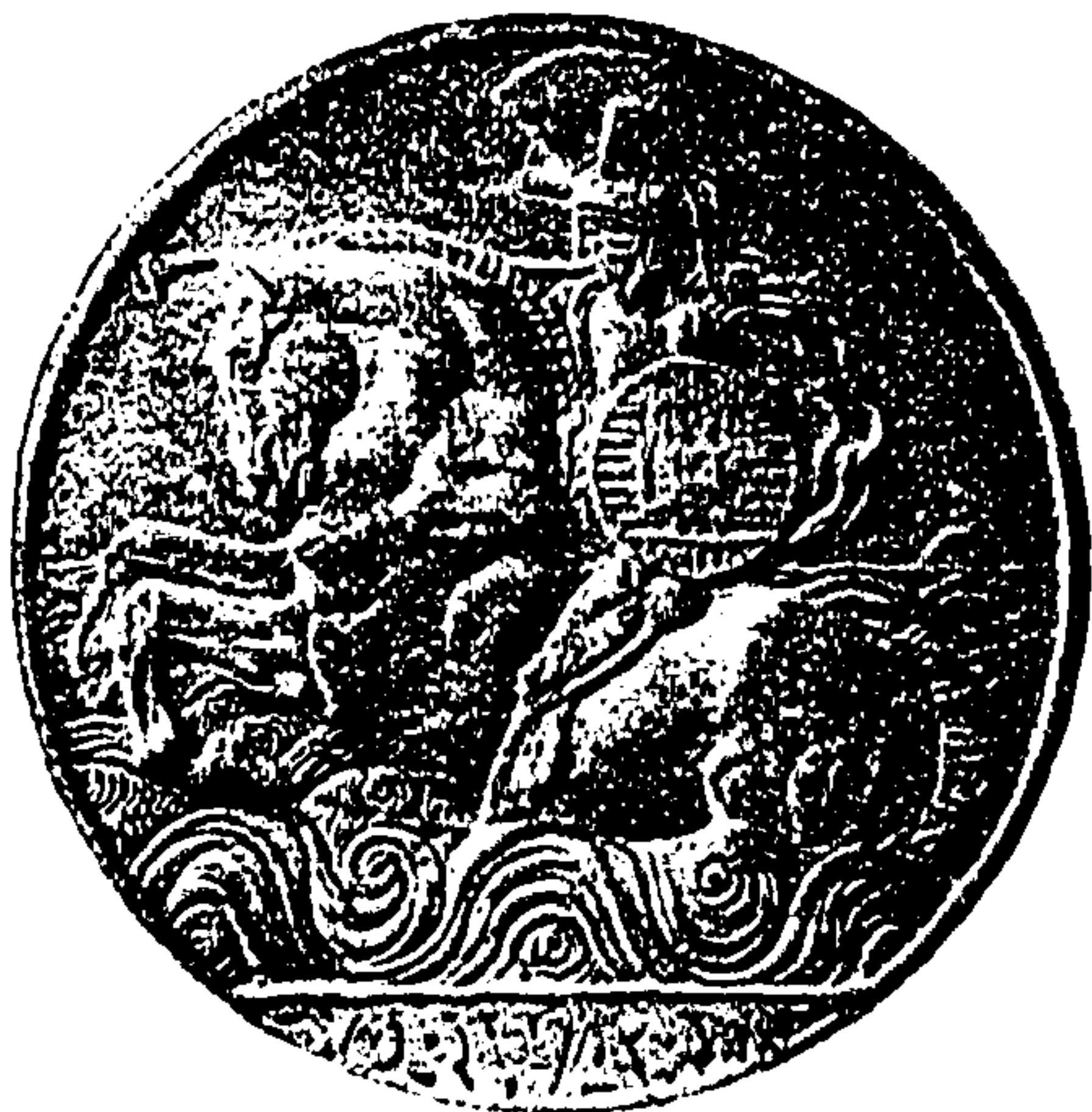
Erinnerungsmedaille an die österreichische Adria-Ausstellung. (Mit Text.)

„Ja, so sei es! Winneburg ist der richtige Platz.“