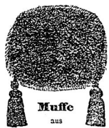
Muffe aus langhaarigem Pelz.