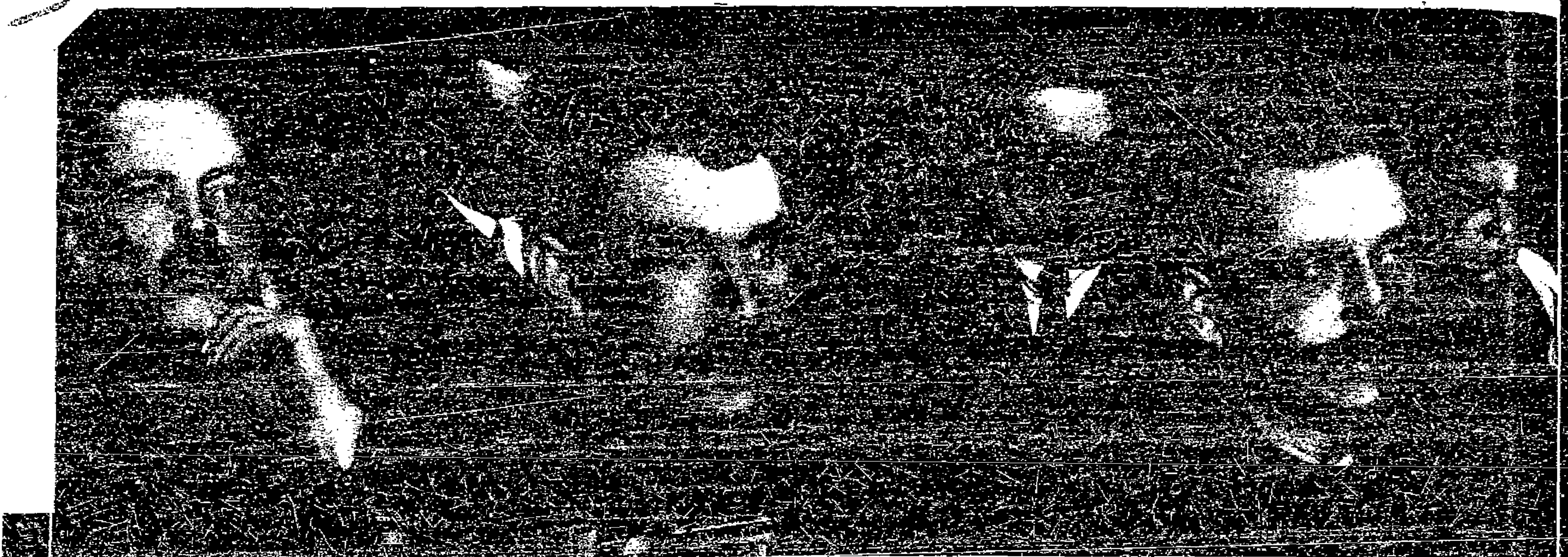
Am 23. und 24. Januar tagte in Berlin der 1. Deutsche Reichsbauernkongress Der Kongress war besetzt von 145 Delegierten aus allen Teilen des Reiches. Besonders stark waren vertreten Brandenburg mit 28, Niederrhein mit 21 und Magdeburg-Anhalt mit 20 Delegierten. Unter den Delegierten befanden sich Mitglieder des Schlesischen Landbundes, der Christlich-sozialen Arbeiter- und Bauernpartei Deutschlands, 3 Mitglieder des Landbundes, zahlreiche Mitglieder des Mitteldeutschen Bauernbundes, der Pommerischen Bauernschaft und des Reichsbauernbundes, Mitglieder der Nationalsozialistischen Partei, der Demokratischen Heusäcker Bauernschaft sowie 25 Mitglieder der SPD, und 14 Anhänger der KPD. Der soziale Zusammensetzung nach gliederten sich die Delegierten in 44 Kleinbauern mit Besitz über 5 ha, 58 Kleinbauern mit Besitz unter 5 ha, 16 Zwergbauern, 7 dörfliche Bauern, 7 Fischer unter 5 ha, 4 Fischer über 5 ha, 3 landwirtschaftliche Gewerbetreibende, 5 Winzer und 5 Landerbeiter.