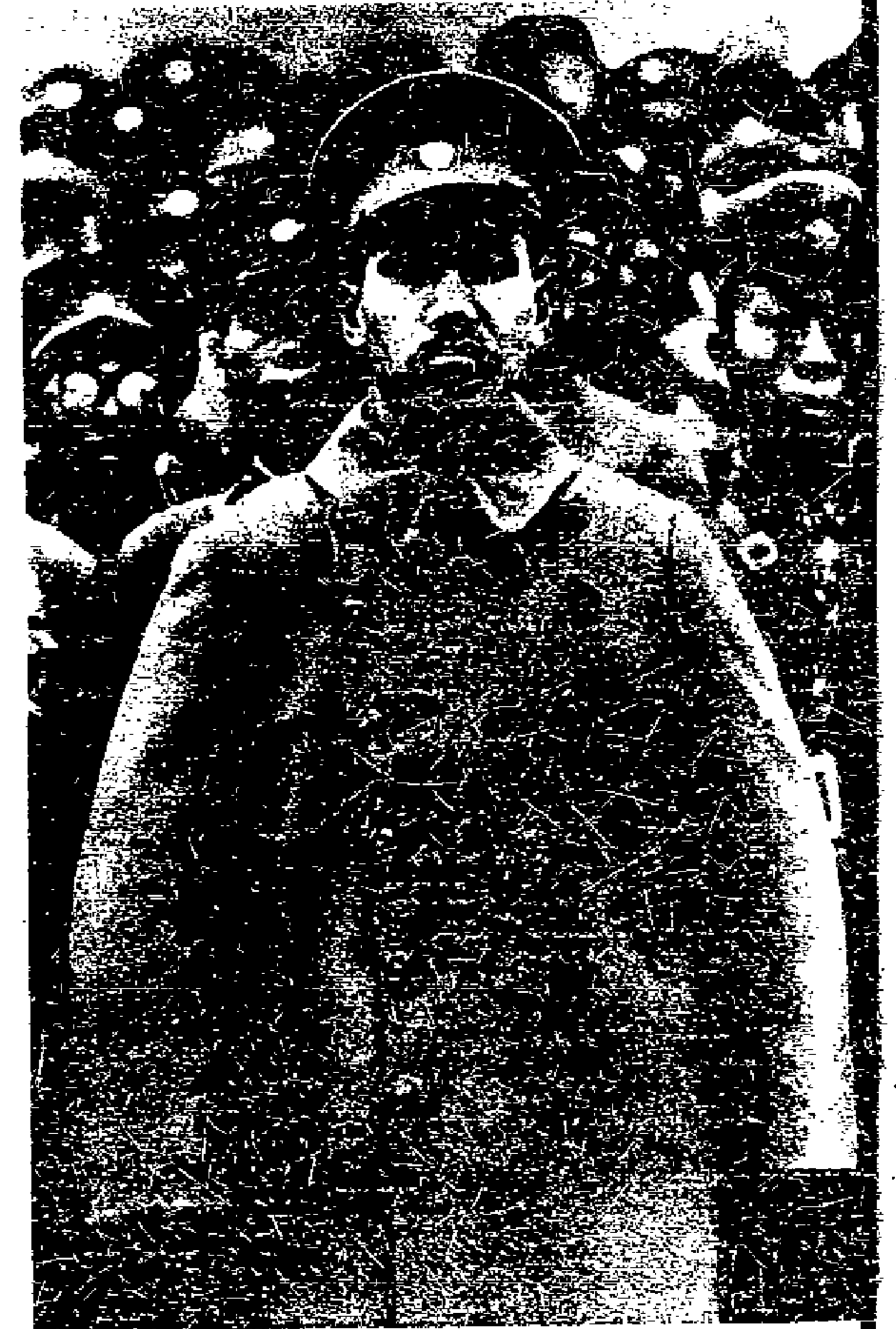
Der Henker spielt Komödie General Tschiangkeischek, der blutbesudelte Henker chinesischen Proletariats und gekaufte Soldknecht Weltimperialismus hat sich als „einfacher Soldat“ kleidet, um so wieder den Werktätigen zu imponieren Das chinesische Volk hat ihn durchschaut . . .