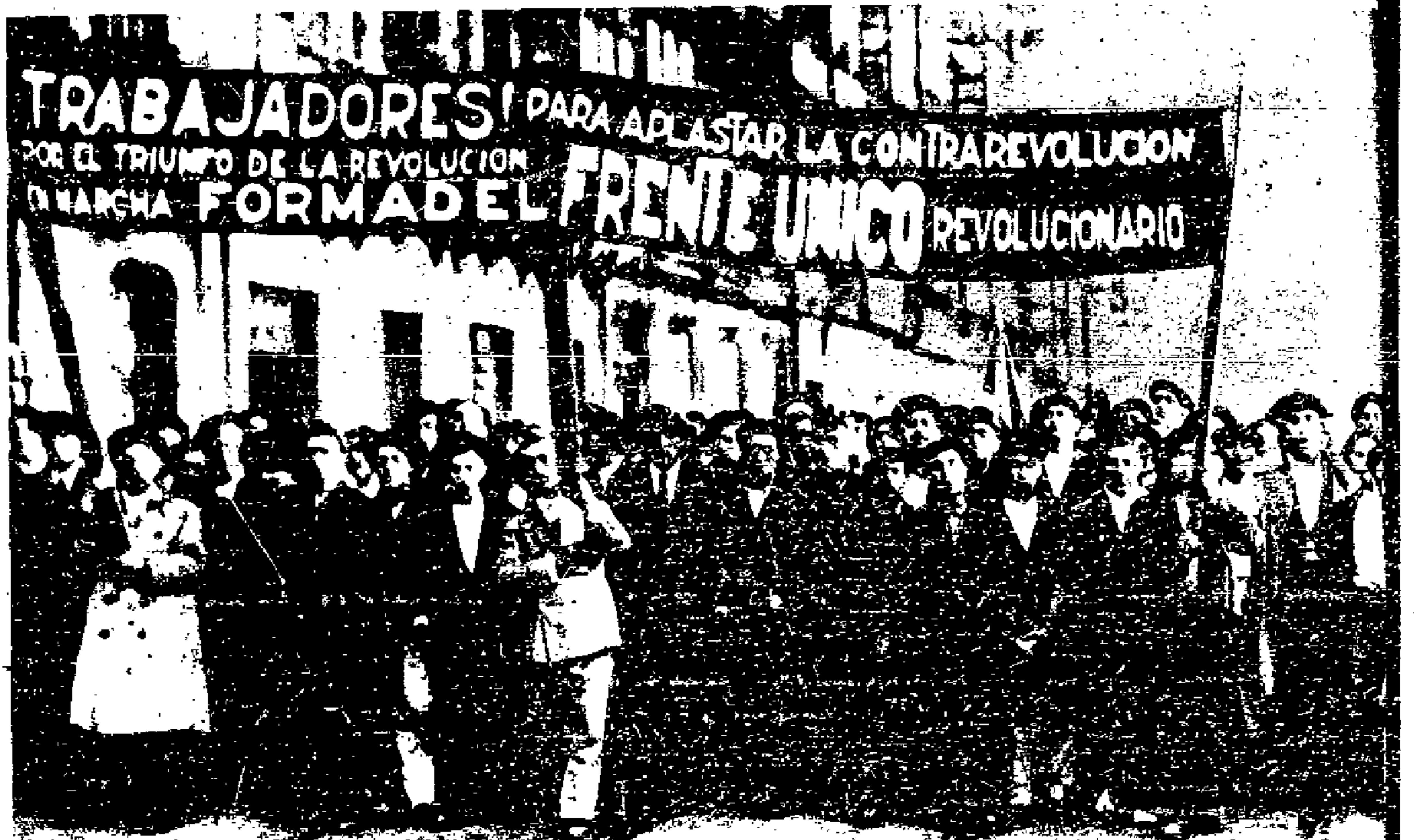
Im Zeichen der Roten Einheitsfront Kommunistische Demonstration in Bilbao — Spanien