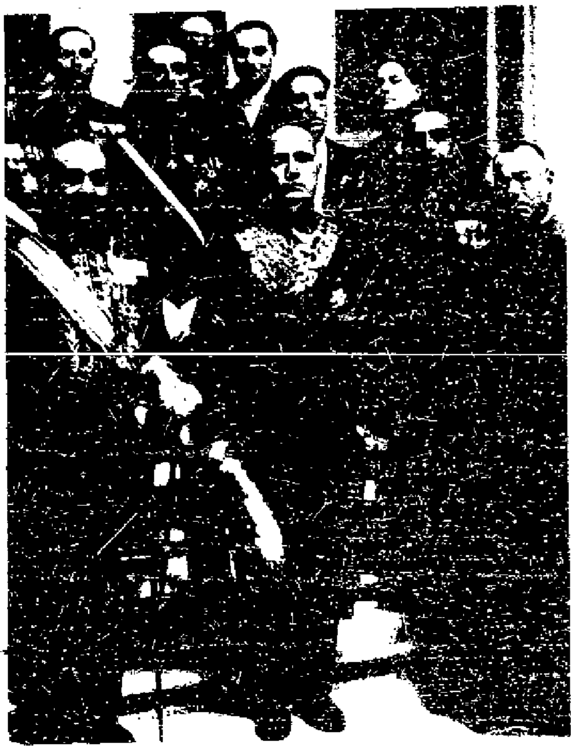
Mussolini. Hungerrevolten und steigende Arbeitslosigkeit, Streiks bedrohen den faschistischen Staat. Unser Bild zeigt Mussolini nach dem Besuche beim Papst, dessen Klerus den Faschismus stützen soll