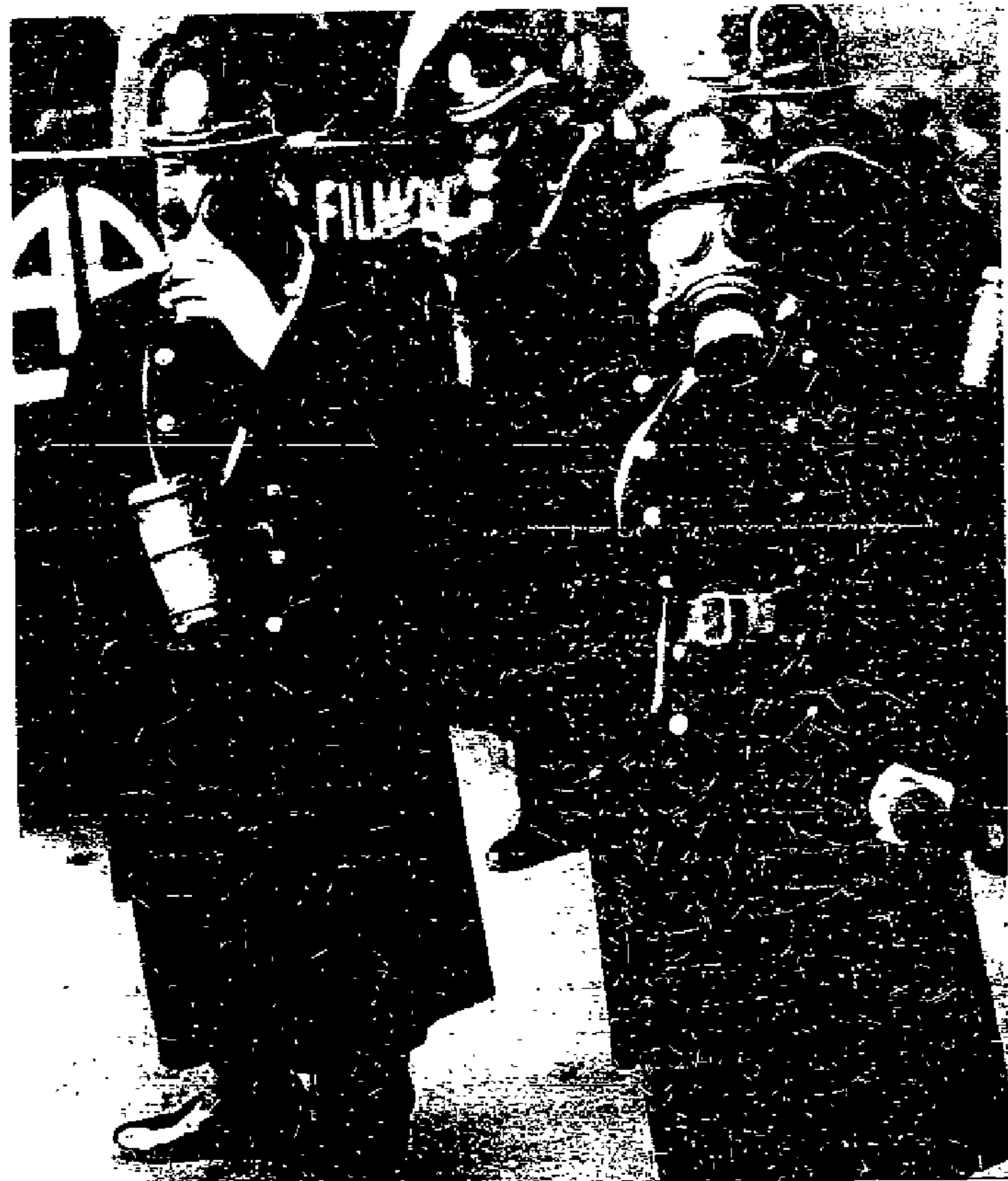
Mit Tränengas gegen den Hunger. Die neue Ausrüstung der Prager Polizei