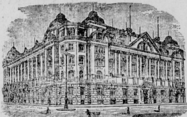
Gesellschaftsgebäude in Leipzig, Thomasing 21.

vormals Lebensversicherungs-Gesellschaft zu Leipzig, errichtet 1830.