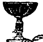
Champagner 25 Pf.