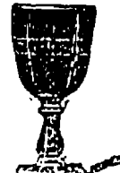
Wasser u. Bier 35 Pf.