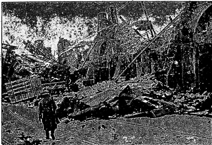
BR-Aufnahme: Kriegsbericht Lönies' (Wb.)