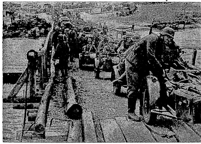
Wohel an dem Durcheinander von bespannten und motorisierten Fahrzeugen, die die fliehenden Bolschewisten zurückgelassen hatten, rollen unsere Kraftschiffe über den Boden.

Unter Führung des Leutnants zur See Dickhaut und des Oberleutnants Meckler griffen die deutschen Seestreitkräfte an der gefährlichsten Fesselung der Insel die feindliche Boote unter Brückensicherung an.