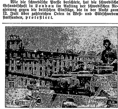
Wer ist im Besitz von Woronesch? Unser Bild zeigt den Einmarsch deutscher Truppen in Woronesch. Panzer stoßen bis zur Stadtmitte durch. ...