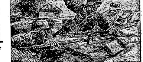
„Daran sehe Leib und Blut, Kraft, Macht, Gewalt und Gut, Dein Vaterland zu retten.“