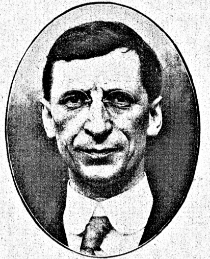
E. De Valera, der „Präsident der irischen Sinnfein- Republik“, der mit Lloyd George über die Durchführung der irischen Selbst- verwaltung verhandelte.