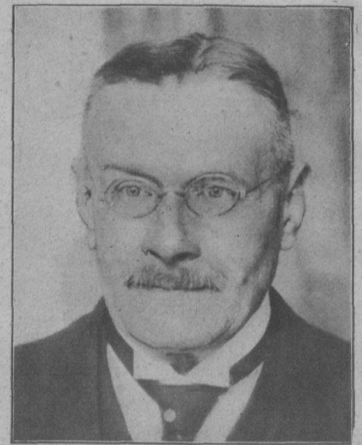
Prof. Dr. Albert von Le Coq, der die Leitung der Indisch-Asiatischen Abteilung des Berliner Völkerkundemuseums übernahm.

— — Die helle Nacht lag über dem Lande. Der Himmel über dem Boden war licht. Der reife Mont stand so, daß er gerade in Selenens Zimmer hineinsah