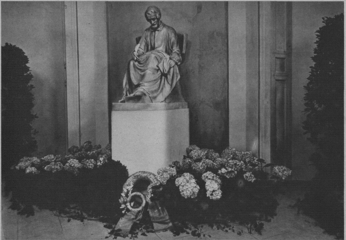
Endlich Ruhe gefunden: Das Feine-Denkmal, von Wilhelm II. aus dem Achilleion auf Korfu entfernt, in Hamburg mit Tinte besprüht und dann hinter Brettern verborgen, ist jetzt in Altona endgültig aufgestellt worden.