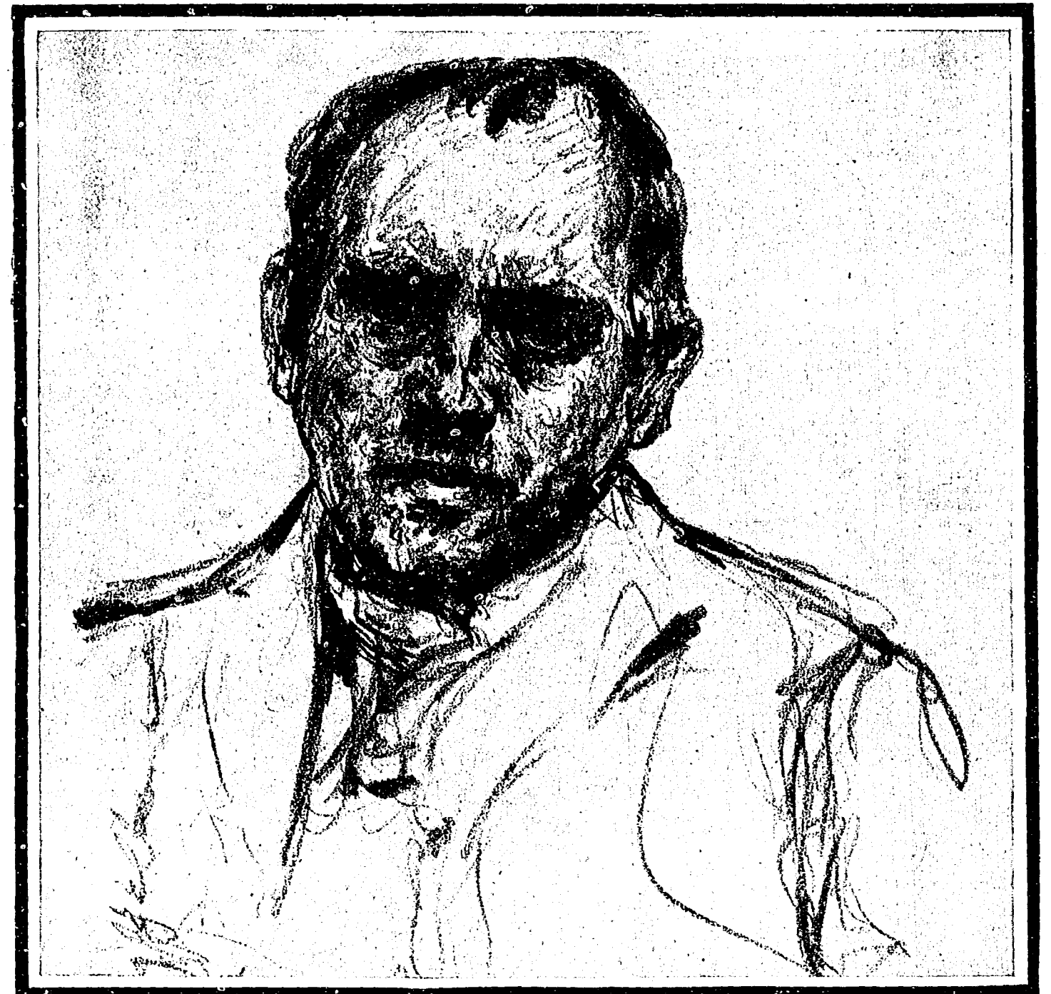
Louis Corinth †

Silbenrätsel: 1. Eiland, 2. Uniamwest, 3. Draak, 4. Wotan, 5. Irene, 6. Gneisenau, 7. Vulkan, 8. Herakl, 9. Reife, 10. Zagan, 11. Esterhazy, 12. Eiohim, 13. Teleskop, 14. Heisterbad, 15. Orinota, 16. Valentin, 17. Enten, 18. Margite = Ludwig van Beeth von: Die neunte Symphonie. Kreuzworträtsel. Waagrecht: 2. Amme, 3. Gluck, 4. Ari, 5. Emma, 7. Vania, 9. Wolga, 11. Wald, 12. Egon, 15. Galdo, 16. Eger, 18. Toul, 19. Vana. — Senkrecht: 1. Stigall, 6. Wauer, 8. Wawe, 10. Amam, 14. Alan, 13. Tell, 17. Grat, 19. Hans, 20. Dhlau, 21. Helgoland.