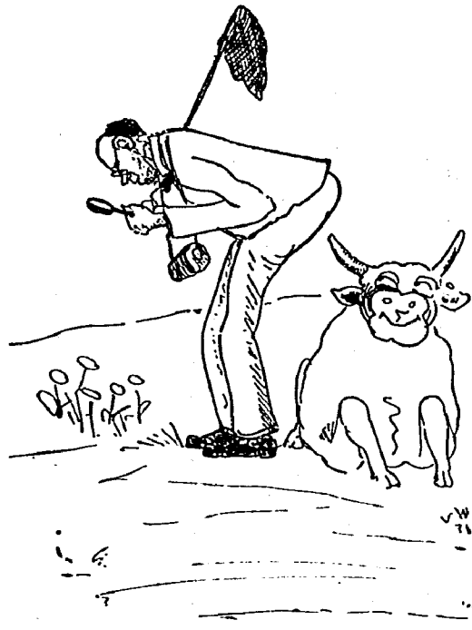
Obacht, lieber Freund, — wenn du dich jetzt lebst — machst du noch 'ne andere Entdeckung — — —

Kinderlogik. „Mama, ich habe drei Bonbons genommen.“ — „Das ist brav, daß du die Wahrheit sagst. Drum sei es verziehen!“ — „Mama, dann bekomme ich noch ein Bonbon, ich hatte nur zwei genascht.“