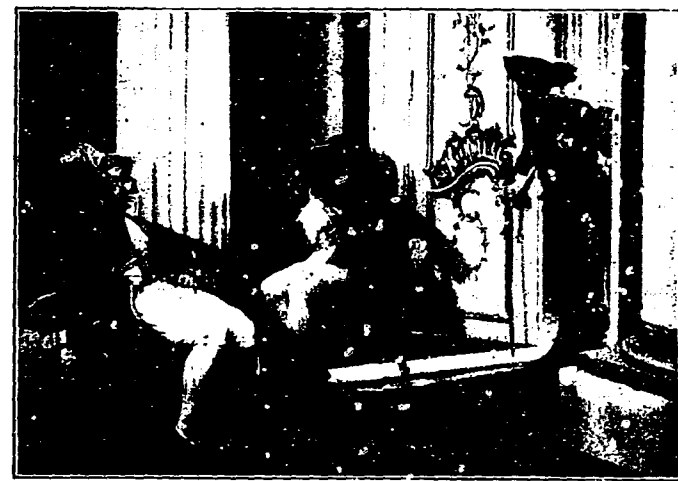
„Der alte Krieg“ Friedrichs großer König und seine Zeit werden in dem neuen Großfilm der National-Film-Ges. wieder lebendig. Er umfaßt die Zeit von der Beendigung des siebenjährigen Krieges bis zum Tode des so menschlichen gewordenen „Einleiters von Sanssouci“. Aufser den Vorgängen am preussischen Königshof tauchen auch Kaiserin Maria Theresia, Josef II., Katharina von Rußland usw. auf — Bild links: Wintervortrag bei Maria Theresia. Von links nach rechts: Kaiserhofhof von Salzburg, Maria Theresia, Kaiser Josef II. Bild rechts: Die eingeschlagenen Reitbraten.