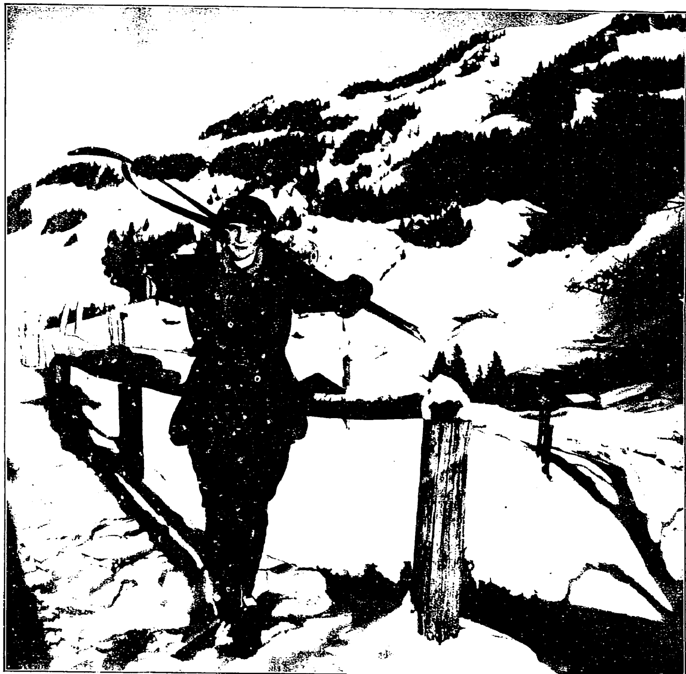
Der Sonne entgegen!

Wagerecht: 1. Schweizer Nationalheld, 1. vorweltlicher Fischhäuter, 6. Nagetier, 7. Straßenschmutz, 9. junges Kind, 10. Menschenraffe, 12. Hoherpriester, 11. Station der Brennerbahn, 15. Ferment des Malzermagens, 17. Nebenfluß des Rheins, 19. Tageszeit, 21. Ort in Oberbayern, 23. Frauengesicht der Riblungenjage, 24. Wehrmacht, 25. Blütenstands.