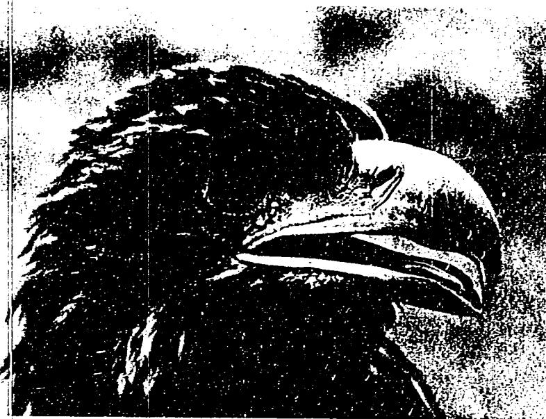
Der König der Vogelwelt (Hellas)

Gegen das Ausfallen des Kopfhaares Ist Zwiebeljuice ein gutes, im Orient seit altersher bekanntes Mittel, das auch die alten Griechen und Römer bereits gekannt haben. Die kahlen Stellen des Kopfes sowie die Haarwurzeln werden mittelst einer durchgeschnittenen Zwiebel eingerieben.