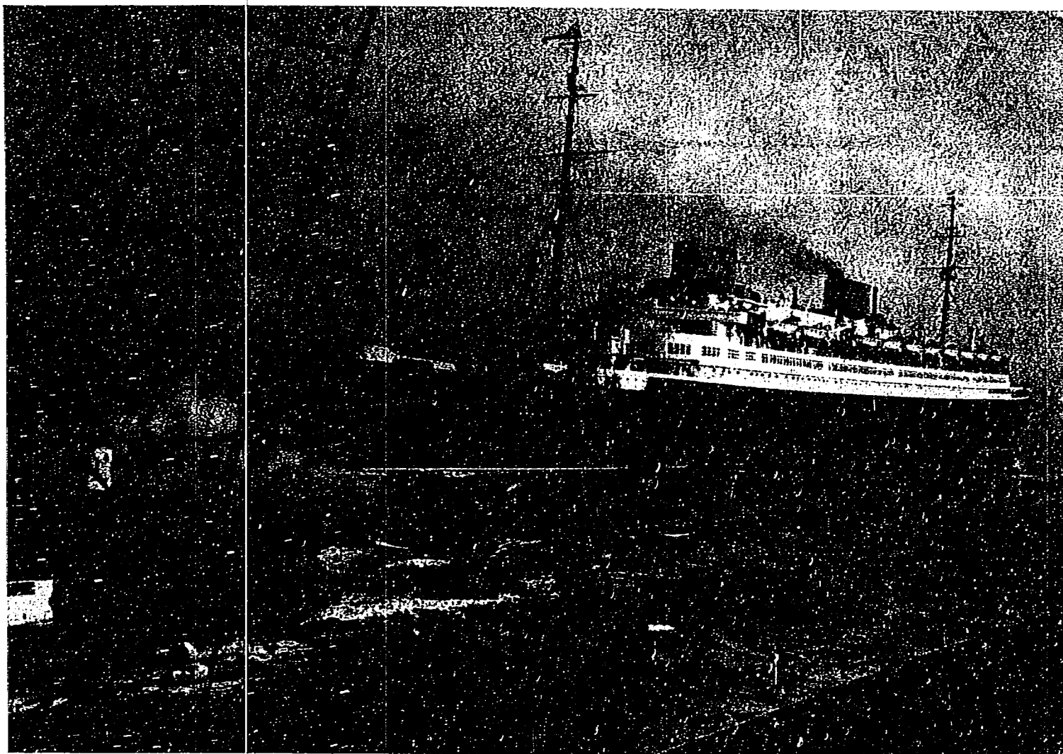
Die erste Ausfahrt. Das riesige Schiff wird von Hochseeschlep- pern aus dem Hamburger Hafen die Elbe abwärts gebracht.