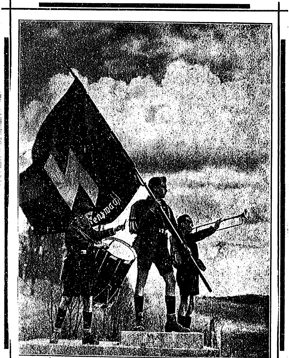
Jugend ist Zukunft

Humanist, Uhrmacher, Namaqua, Demagog, Somali, Tomate, Armada, Germane, Emmaus. — Hundstage.