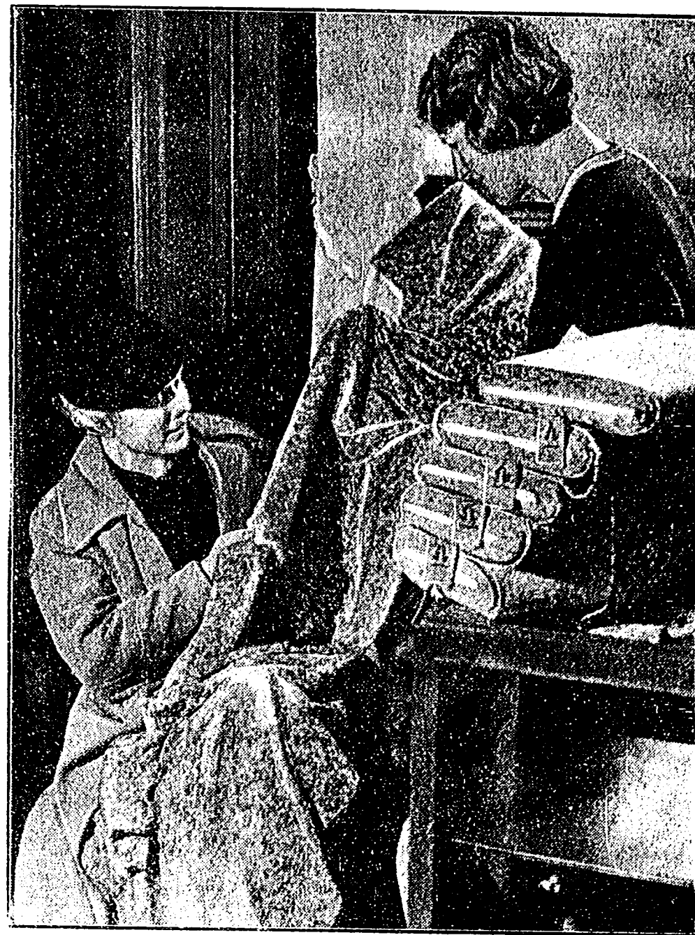
Ein schwerer Entschluß