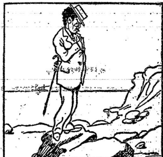
Тов. Троцкій поселится на островѣ св. Елены.