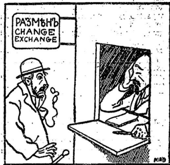
Тов. Дзержинскій займется размыномъ.