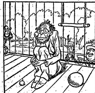
Тов. Радекъ скоро найдетъ пріютъ.