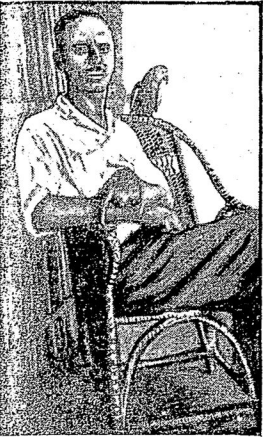
Авторъ «Писемъ изъ Конго».

В эти дни мнѣ мѣстный царекъ большую обесьяну, что-то въ инги-уанга; она сидитъ въ бамбуковой, очень злая и рожа отвратительная ее Троицкой. А поугай того-же царька, который все время болтаетъ что-то мало понятное называю Керенский. Я говорю что обезьяна — тоже не очень хитрый, который не годится того, чтобы его не заставили (здесь животные не работают, итды, бываю тоже. Работаютъ веры). Такъ вотъ, если-бы обезьяны, то было обязательно ее заставить работать.