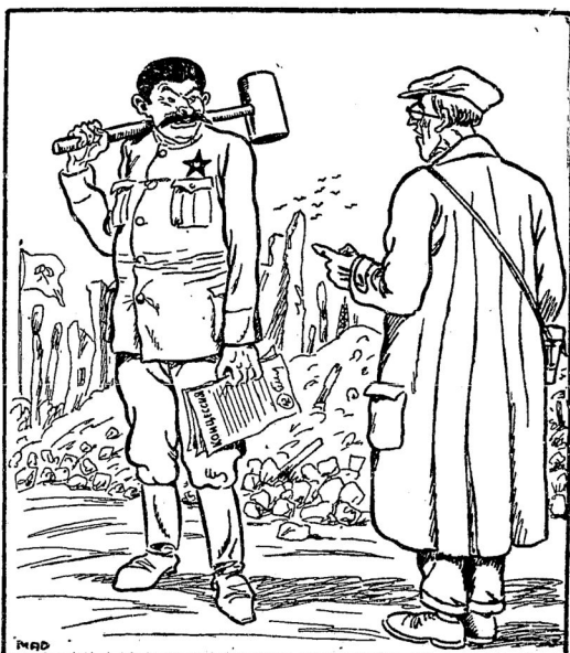
— Этого молотомъ служить вамъ для восстановления страны? — Нѣтъ: для распродания ея съ аукциона.