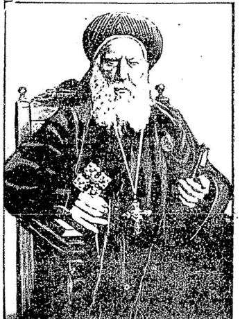
Патріархъ Кирилл V, стоявшій въ теченіе 53 лѣтъ въ главѣ православныхъ церквей Египта, Абиссиніи и Судана, сконча-вшійся въ Каирѣ въ возрастѣ 103 лѣтъ.

На этихъ дняхъ ходилъ съ мѣстными нарыкомъ на охоту. На немъ былъ только широкий кожаный поясъ съ огромной корю-кой для патроновъ и больше ничего, если не считать небольшого куска матеріи сиве-реди и пера на головѣ. На плечѣ длин-нѣйшее кремневое арабскаго типа ружье, все первозданное проволокой съ винтами въ деревянныя чашки мѣдными гвоздями. Отправляясь, онъ мнѣ обещалъ, что четыре носильщика не спугнутъ того что мы на-стрѣляемъ. Пошли, бродили до темноты по чертовымъ зарослямъ и кустарникамъ и ни разу даже не стрѣляли. Я приписываю это моему ступичку нарыку, который уди-вительно сильно и противно пахнетъ, ду-маю что не только слоны, у котораго очень острое чутье, но и самая воюющая обезьяна за версту его чуяла. Я все время стара-лся держаться поды вѣтромъ, иначе было не возможно. Я долго припоминалъ, чѣмъ онъ пахнетъ и поды конякъ вспомнилъ: это горькій стальной клей, разведенный на сѣроводородѣ. Одно можно сказать — уди-вительно душной господинъ. Теперь я понялъ, что значить выраженіе «воюющий негръ» на практикѣ. Сегодня я убилъ буй-волу, вѣтъ въ 3 часа ночи. Сначала въ «стило», потомъ пѣшкомъ добрался до мѣ-ста, сначала мы шли, потомъ ползли на четверенькахъ, когда хрустѣли вѣтки, негръ оборачивался и грозилъ мнѣ кулакомъ, — жестъ, который нормально ему и въ голову не придетъ, но, какъ охотникъ, я это пони-малъ и прощалъ. Къ началу разсвѣта до-ползли до крупнаго куста. Негръ его осто-рожно раздвинулъ и я въ шагахъ 30—80