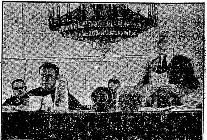
Сѣва Вышинскій, справа Крыленко, оглашающій обвинительный актъ.