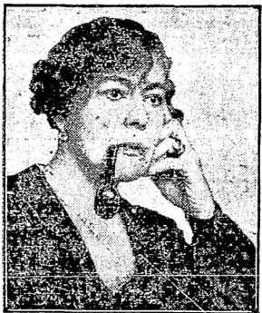
Известной писательницѣ, вдовѣ германскаго посланника, минуло 8 марта 50 лѣтъ.