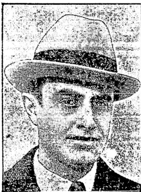
становится во главѣ воздухоплавательнаго треста съ капиталомъ въ 840 милл. марокъ.