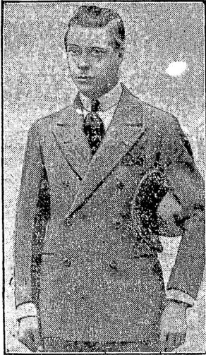
будущій регентъ Англіи.