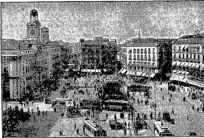
Площадь Солнца, на которой 12 марта произошли студенческія демонстраціи противъ диктатуры.