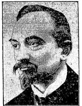
Чичеринъ вице-предѣловъ СССР.