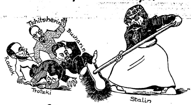
Сталинъ выметаетъ мусоръ.