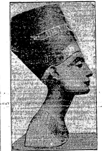
Египтяне претендуютъ на получение находящейся въ берлинскомъ Старомъ Музее статуи, найденной въ 1913 г. при раскопкахъ германскаго восточнаго общества.

Druck und Verlag Zeitungsverlag Rul G.m.b.H., Berlin. Verantwortlich für Redaktion Georg Otfroschmoff, Berlin-Wilmersdorf, für Anzeigen Eugen Kummlich, Berlin-Wilmersdorf.