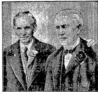
Наверху — Элиссонъ и Фордъ. Справа — король египетскій Фуадъ.