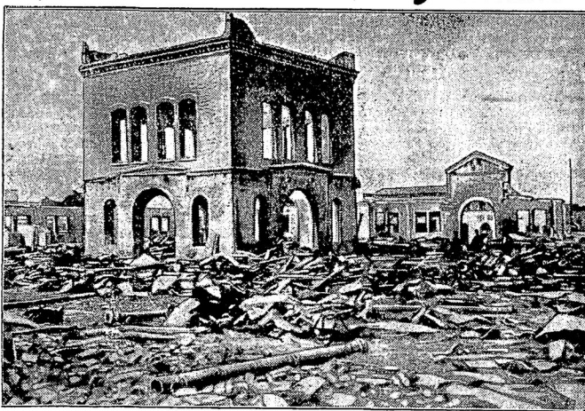
Развалины гор. Торреона — послѣ обстрѣла правительственными войсками.