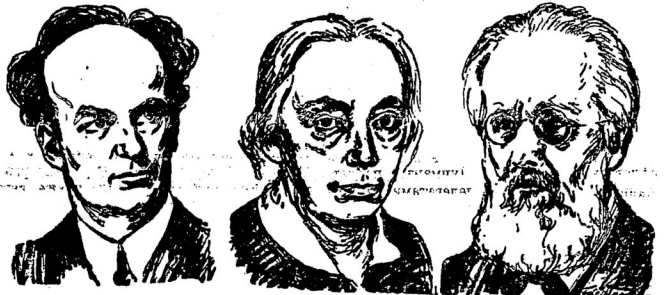
„Pour le Mérite“

никакихъ данныхъ для подобныа подтвержденія пока не имѣется. Но Мандельштаму и не нужно никакихъ данныхъ. Усердіе все замѣняетъ.