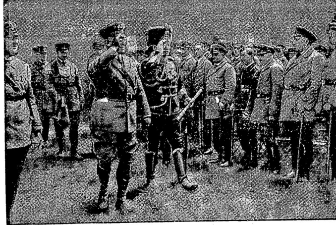
Фельдмаршалъ Макензенъ передъ фронтомъ союза „Стальной Каски“, собравшагося въ Мюнхенѣ въ числѣ около 100-тиа. человекъ.