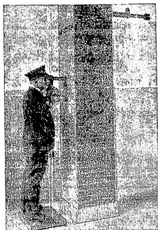
Новое изобрѣтеніе подъ этимъ названіемъ, состоящее изъ сочетанія оптическихъ инструментовъ контрольнаго аппарата и системы трубъ, даетъ возможность въ любое время промониторировать состояние бронированной банковской камеры.