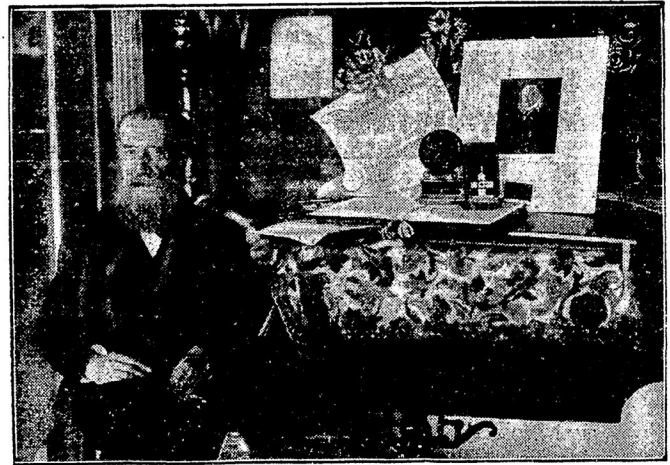
17-го июня старѣйшій германскій ученый-юристъ торжественно праздновалъ свое 80-лѣтіе. Президентъ республики прислалъ юбиляру государственный гербъ съ надписью «хранителю и создателю права», а также и свой портретъ. Юбилея поздравляло множество государственныхъ и ученыхъ учреждений, видныхъ людей всѣхъ областей культуры и пр.