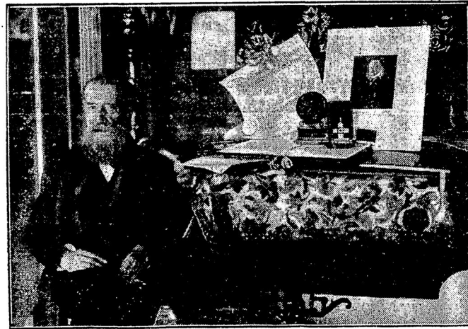
17-го юнія старѣйшій германскій ученый-юристъ торжественно праздновалъ свое 80-лѣтіе. Президентъ республики прислалъ юбиляру государственный гербъ съ надписью «хранителю и создателю права», а также и свой портретъ. Юбилея поздравляло множество государственныхъ и ученыхъ учрежденій, видныхъ людей всѣхъ областей культуры и пр.