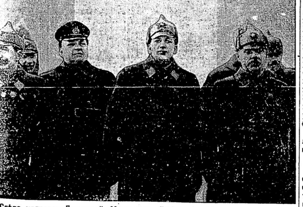
Слѣва направо: Буденный, Муилевичъ, Бубновъ и Ворошиловъ.