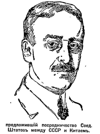
предложившій посредничество Соед. Штатавъ между СССР и Китаемъ.

Въ Мукденѣ спокойно. Лондонъ, 22. 5. Мукденскій корреспондентъ «Times» телеграфируетъ, что правитель Маньчжуріи въ воскресенье прѣхалъ въ Мукденъ. По сравнению съ Шанхаемъ и Пекиномъ въ Мукденѣ совершенно спокойно. До сихъ поръ ни одинъ солдатъ еще не мобилизованъ.