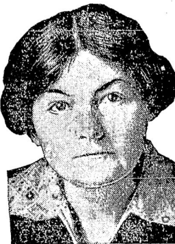
Маргарита Бонфильде, министръ труда которой предстоитъ разрѣшить вопросъ о лакаутѣ 500 тысячъ текстильных рабочихъ.