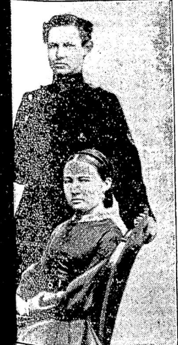
Гинденбургъ съ сестрой, — въ молодости.