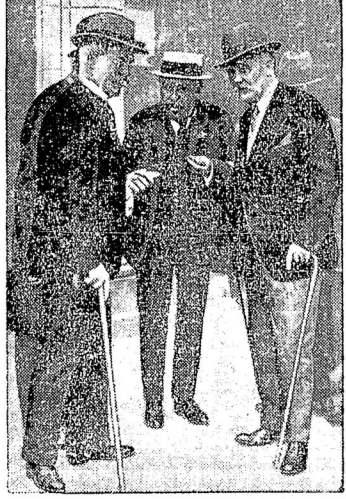
(Слѣва направо) Макдональдъ, Брианъ и французскій министръ труда Лушеръ.