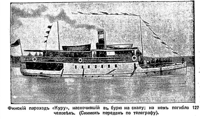
Финскій парокходъ «Нуру», насочившій вь бурю на скалы; на немъ погибло 127 человекъ. (Снимокъ переданъ по телеграфу).