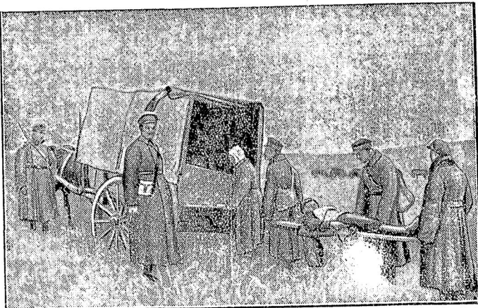
Переносятъ раненыхъ въ тылу