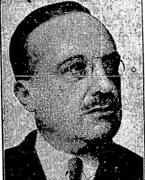
Тардь, бывший и, может быть, будущий французский премьер.

Париж, 18. 2. В Елисейском дворце идут совещания между президентом республики, председателем законодательных палат и лидерами партий.