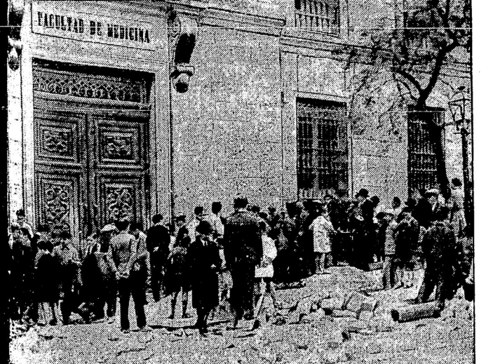
Главное столичное полиціи со студентами въ Мадридѣ произошло передъ зданіемъ медицинскаго факультета. Здѣсь выстрѣлами полиціи, отбѣжавшей на бомбардировку камнями со стороны студентовъ, былъ убитъ прохожій.