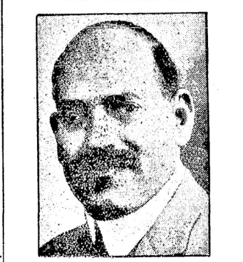
Нагасъ-паша подалъ въ отставку со всѣмъ своимъ кабинетомъ, въ виду отказа короля Фуада подписать законопроектъ о защитѣ конституціи. Предполагаютъ, что отказъ послѣдовалъ, въ виду опасенія короля, что этотъ законопроектъ послушаетъ уменьшенію его авторитета.