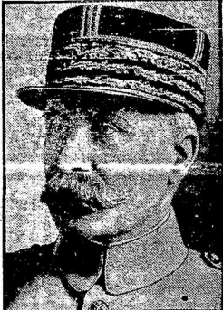
Вице-президентомъ верховнаго военнаго совѣта Франціи назначенъ одинъ изъ виднѣйшихъ военачальниковъ Великой войны, маршалъ Петэнъ, тѣмъ самымъ становящійся генералиссимусомъ всѣхъ французскихъ войскъ.