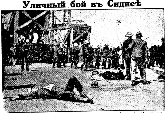
Волна коммунистическихъ беспорядковъ докатилась и до Австраліи. На улицахъ Сиднея произошли серьезныя столкновения полици съ коммунистами, въ результатѣ которыхъ были тяжело ранены.

Въ виду настойчивыхъ слуховъ о перенесеніи центра безбожнаго интернаціонала въ Берлинъ, Германскій евангелійскій женскій союзъ обратился къ министру внутреннѣхъ дѣлъ съ ходатайствомъ о воспрепятствованіи этому намѣренію советской власти, которое разсматривается военными христіанами какъ издѣвательство надъ ихъ религіозными чувствами.