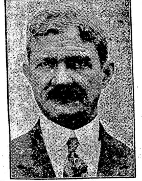
Д-ръ Р. Альфаро провозглашенъ президентомъ Панамы