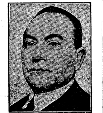
Германскій министръ иностранныхъ дѣлъ въѣхалъ въ Женеву на сессію Совѣта Лиги Націй