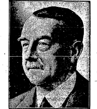
Англ. Лейнъ министръ иностр. дѣлъ предсѣдательствуетъ на открывающейся сессіи совѣта Лиги Націй, вмѣ- сто германскаго министра иностр. дѣлъ

будудитъ ее къ умеренности, Гендерсонъ, якобы находить, что германскія требованія по отношенію къ Польшѣ «преувеличены». Съ другой стороны весьма осѣдломленный, какъ обычно, сотрудничать «Матанъ» Сор- вейнъ утверждаетъ, что Польша готова уплатить убытки, понесенные нѣмцами, въ Силезіи и такимъ образомъ Германія нѣтъ никакой необходимости обострять кон- фликтъ.