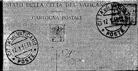
Почтовая карточка новаго государства Ватиканъ.

нѣ чуть было не осталась безъ коммуни- стической газеты, а между тѣмъ этотъ дѣнь годовщина смерти Либнехта и Розы Люк- сембургъ. А причина забастовки заклю- чается въ томъ, что пресловутый Монше- бергъ перенесъ печатаніе вечерней комму- нистической газеты изъ коммунистической типографіи въ капиталистическую, гдѣ пе- чатаніе показалось ему болѣе выгоднымъ. Въ виду этого коммунистическая типографія приступила къ увольненію 50 человекъ, что и вызвало волненіе среди рабочихъ изъ ко- ихъ 20 человекъ забастовали. Фамиліи ихъ и даже съ адресами жирнымъ шрифтомъ пе- речислены въ «Rote Fahne», но приходится здѣсь ограничиваться словесными троками и подпольными махинаціями, а не «показа- тельнымъ процессомъ».