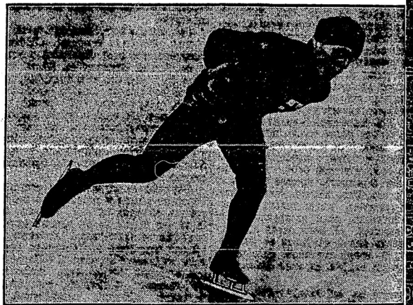
Финляндскій чемпионъ бѣга на конькахъ Тунбергъ на озерѣ въ С.-Морицѣ шилъ свой собственный рекордъ бѣга на конькахъ, на разстояніе 500 мѣтъ. Онъ пробѣжалъ это разстояніе въ 42,6 секунды.