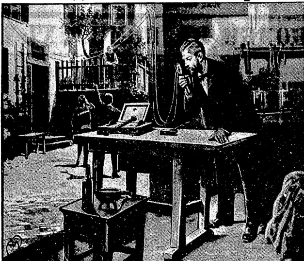
Въ 1861 году германскій педагогъ Филиппъ Рейссъ устроилъ изображенный на фотографіи примитивный телефонъ, которымъ онъ сообщался изъ своей рабочей комнаты съ своей квартирой.