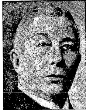
Бывшій голландскій министр финансовъ Колинъ.

Докладчикъ отмѣчалъ, что 29 европейскихъ правительствъ высказалось на конференціи за осуществленіе принятыхъ ею принциповъ. Между тѣмъ, какъ на практикѣ не было предпринято даже попытокъ сократить таможенныя пошлины. Докладчикъ напомнилъ, о рѣшеніяхъ послѣдней сессіи Лиги Наций, о несуществующемъ продолженіи таможеннаго перемѣрия и призналъ результаты послѣдней хозяйственной конференціи совершенно ничтожными. Необходимо открыто заявить, сказалъ онъ, что неудача хозяйственной конференціи объясняется отсутствіемъ духа согласія. На хозяйственной конференціи 1927 г. была признана полная неудовлетворительность тогдашняго хозяйственнаго положенія, но послѣ четырехъ лѣтъ тяжелой работы никакого улучшенія не послѣдовало. Поэтому во многихъ странахъ совершенно из-