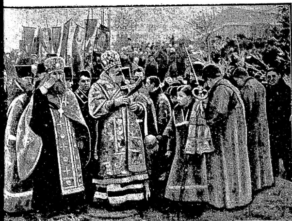
Водно въ Крещеніе происходитъ освященіе Двины рижскимъ православнымъ епископомъ. На снимкѣ архіепископъ Іоаннъ въ тысячной толпѣ, уносящей домой освященную воду въ бутылкахъ и кружкахъ.