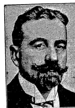
Д-ръ Кюльцъ, бывший министръ внутридѣлъ, депутатъ Рейхстага, бургомистръ Дрездена.

Въ пятницу въ 6 час. вечера въ кулуарахъ Рейхстага затрѣбли револьверные выстрѣлы. Пожилой господинъ, стоящій около депутата Кюльца (оберъ-бургомистра Дрездена), внезапно выхватилъ револьверъ и три раза выстрѣлилъ въ воздухъ. Кюльцъ, рѣшившій, что на него произведено покушеніе, не растерялся и схватилъ стрѣляющаго. Въ это мнновение подбѣжали другіе депутаты, пристава и полицейскіе. Стрѣлявшій не оказалъ никакого сопротивленія.