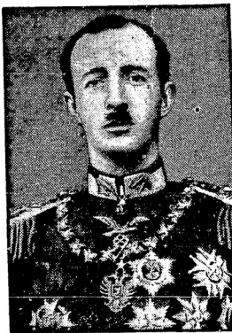
Послѣ окончанія спектакля въ 10½ ч.

Въ ночь 21. 2. Вчера вечеромъ въ вѣнской оперѣ было совершено покушеніе на албанскаго короля Зогу I.