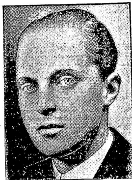
Наслѣдникъ престола, Альфонсъ.

Мадридъ производитъ впечатленіе города, охваченнаго внезапною помѣшательствомъ. Все населеніе высыпало на улицу. Повсюду развѣваются республиканскіе и красные флаги. Или украинцы также и автомобили. На крышахъ трамвайныхъ вагоновъ сидятъ десятки студентовъ,