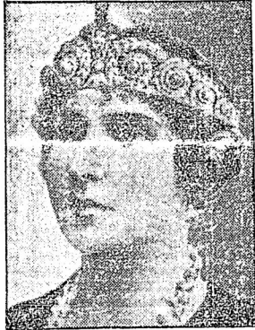
Слѣва — король Альфонсъ, справа — королева.

во время революціонная волна все росла. Альфонсъ рядъ городовъ была провозглашена республика. Въ Барселонѣ вернулся изъ изгнанія старый лидеръ каталонскіе сепаратистовъ полк. Мачія провозгласилъ республику. Въ полдень собрались всенародно лидеры республиканскихъ фракцій и черезъ часъ Алкала Цамора, ставшій во главѣ республиканскаго движенія, явился къ министру ин. Дѣль графу Романосу и потребовалъ, чтобы король Альфонсъ XIII немедленно отренся. Въ противномъ случаѣ республиканцы не могутъ ни за что поручиться. Романосъ въ очередь потребовалъ, чтобы республиканскіе вожди гарантировали жизнь королю. Цамора на это согласился. Король Альфонсъ также не возражалъ противъ своего отреченія, но поставилъ условіемъ сохраненія за нимъ всего его личнаго состоянія.