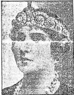
Слѣва — король Альфонсъ, справа — королева.

во время революціонная волна все росла. Альфонсъ рядъ городовъ была провозглашена республика. Въ Барселонѣ вернулся изъ изгнанія старый лидеръ каталонскіе сепаратистовъ полк. Мачія провозгласилъ республику. Въ полдень собрались испанскіе лидеры республиканскихъ движений и черезъ часъ Алкала Камо́ра, ставшій во главѣ республиканскаго движенія, явился къ министру ин. Дѣль графу Романосу и потребовалъ, чтобы король Альфонсъ XIII немедленно отренся. Въ противномъ случаѣ республиканцы не могутъ ни за что поручиться. Романосъ въ очередь потребовалъ, чтобы республиканскіе вожди гарантировали жизнь королю. Камо́ра на это согласился. Король Альфонсъ также не возражалъ противъ своего отреченія, но поставилъ условіемъ сохраненія за нимъ всего его личнаго состоянія.