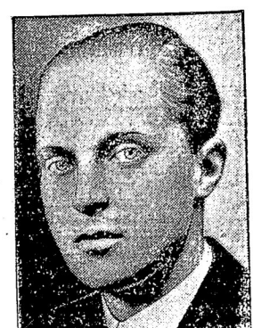
Наслѣдникъ престола, Альфонсъ.

Временное республиканское правительство образовано въ слѣдующемъ составѣ: первый министръ Алкала Камо́ра, министръ ин. дѣль Меррускъ, военный министръ Камо́ра, морской министръ Каврога, министръ финансовъ Прието, министръ внутр. дѣлъ Мануэла Маура, министръ юстиціи