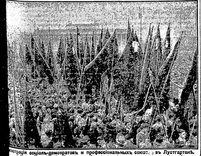
Демонстрація социаль-демократовъ и профессиональныхъ союзовъ въ Люстгартенѣ.

весьма роскошномъ, на которомъ присутствовали почти всѣ акредитованные при советскомъ дворѣ иностранные дипломаты, произошелъ крайне неприятный дипломатическій инцидентъ. Великобританскій посольскій Овей обнаружилъ, что на всѣхъ серебряныхъ вилкахъ, ножахъ и ложкахъ, которыми пользовались приглашенные на банкетъ въ Петербургѣ. Со свойственною дипломатамъ коррентностью, англійскій посольскій на банкетѣ ничего не сказалъ, но вернувшись домой отравилъ Литвинову вербальную ноту крайне неприятнаго содержания. Въ нотѣ онъ запрашивалъ, какимъ образомъ, серебро британскаго посольства оказалось во владѣніи советскаго правительства. Въ заключеніе посольскій требовалъ вернуть его украденное серебро. Литвиновъ отвѣтилъ, что серебро это является собственностью советскаго государства. Если Великобританское посольство можетъ доказать, что это серебро принадлежитъ ему, то оно должно обратиться въ установленномъ порядкѣ въ советскій судъ. Литвиновъ прибавилъ, что онъ не думаетъ, что судъ постановитъ о возвратѣ этого серебра.